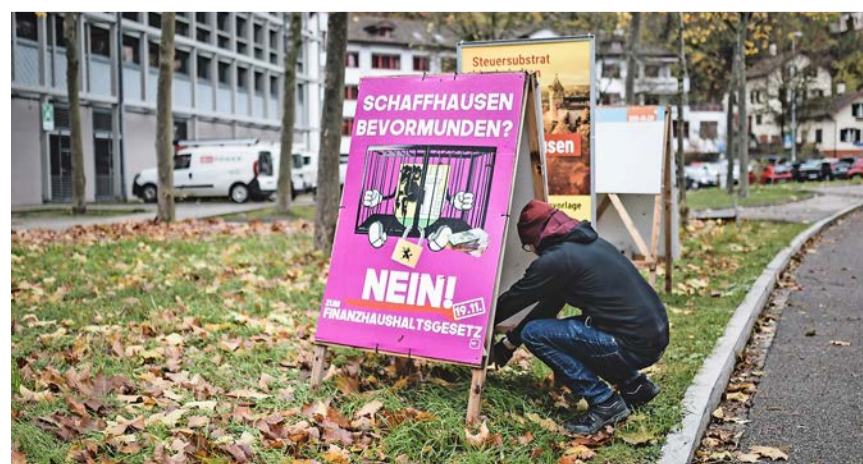
Knapp unterlagen die Gegner der Gesetzesänderung.

Sowohl Befürworter als auch Gegner orteten eine Problematik darin, dass die Vorlage ziemlich komplex sei.